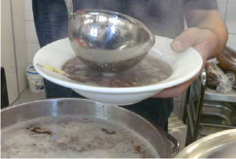
Lecker: Wurstsuppe fer umme!

- Gute Besucherresonanz erfreut Vorstandschaft –