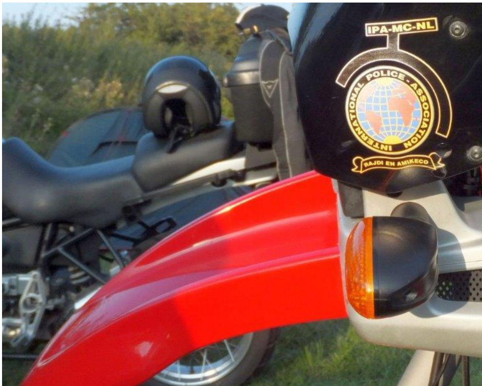
Stammgäste beim Bikertreffen: IPA-MC-NL