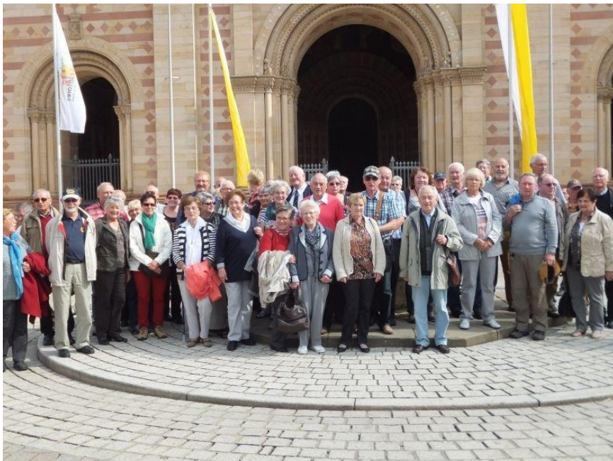
IPA-Seniorentag 2013 in Speyer: Gruppenbild vor dem Kaiserdom

75 IPA-Senioren kamen auf Einladung der IPA-Landesgruppe Rheinland-Pfalz zum Seniorentreffen nach Speyer. Organisiert und ausgerichtet wurde diese landesweite Veranstaltung durch die Verbindungsstelle Speyer. Getreu dem Wahlspruch der IPA „Servo per Amikeco“ stellte sich die Verbindungsstelle Speyer dieser organisatorischen und logistischen Herausforderung, um ihren IPA-Freundinnen und IPA-Freunden die Sehenswürdigkeiten der Domstadt zu präsentieren. Nach einem gemeinsamen Frühstück im IPA-Heim stand ein Stadtrundgang mit anschließendem Bummel durch die Innenstadt sowie eine Schiffstour auf dem Rhein auf dem Programm. Der erlebnisreiche Tag fand seinen Abschluss beim gemeinsamen Abendessen im IPA-Heim Speyer. Die Vorstandschaft der IPA-Verbindungsstelle Speyer bedankt sich bei allen Helfern und Helferinnen, die mit ihrem außergewöhnlichen Engagement zum Gelingen des Seniorentages beigetragen haben. (km)