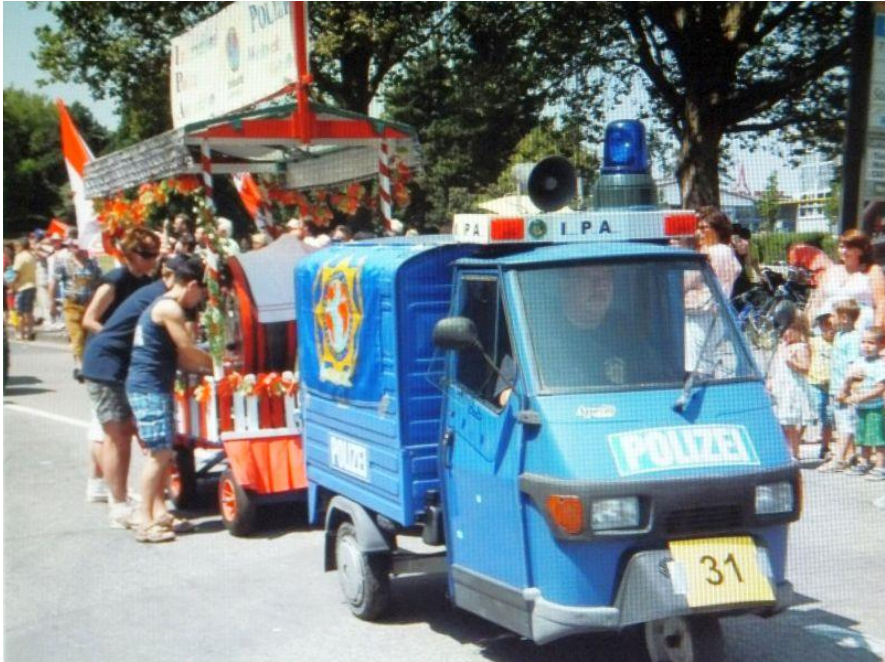
Zugnummer 31: IPA-Verbindungsstelle Speyer